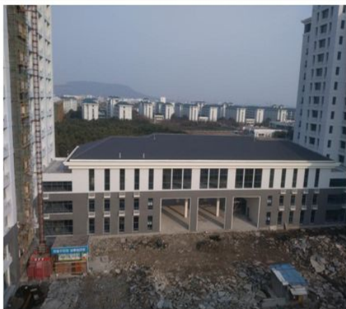
土木交通大楼的门楼:1