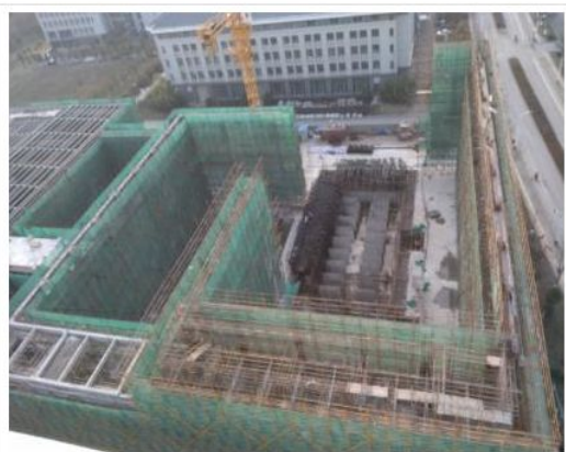
建设中的土木实验大厅