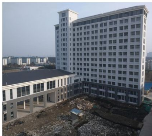
土木交通大楼的门楼:2