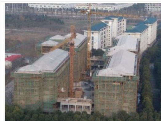
已经封顶的本科生宿舍楼