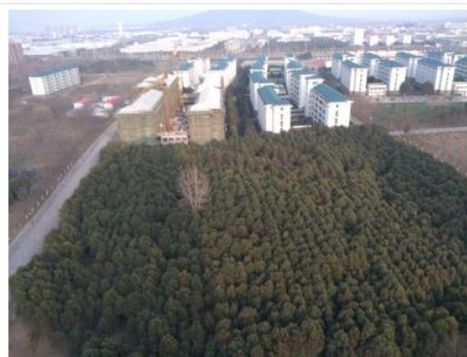
已经封顶的本科生宿舍楼（远景）