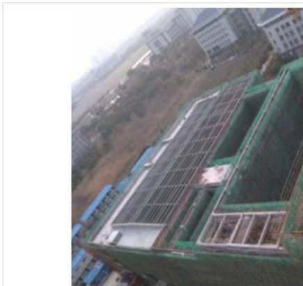
建设中的交通实验大厅